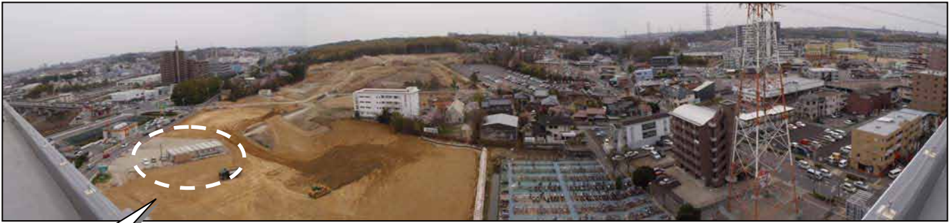
地区の状況（平成 25 年 4 月現在）