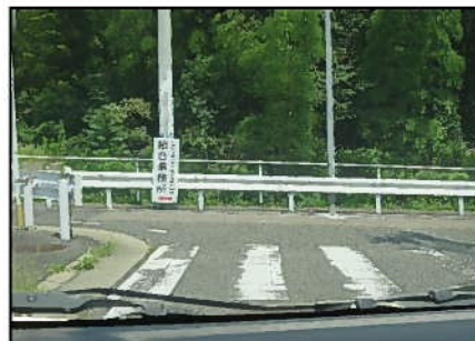
⑤ 赤池白土線交差点