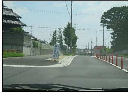
② 赤池白土線、小田赤池線交差点