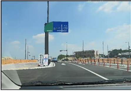
① 小田赤池線、赤池駅前線交差点付近