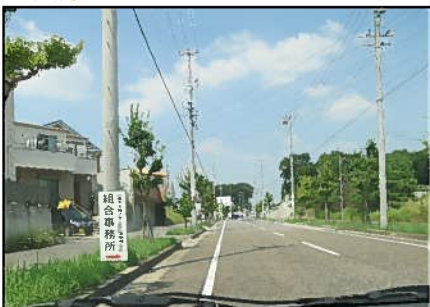
④ 小田赤池線（荒池～赤池小学校東間）