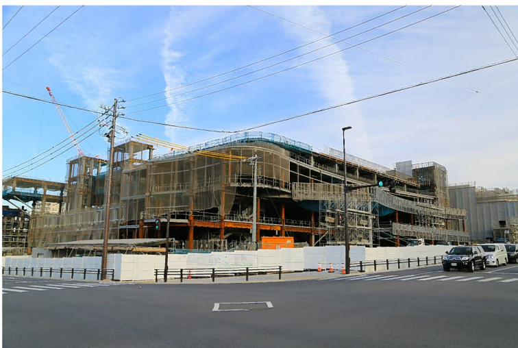
【オープンに向け建築中のイトーヨーカ堂】

工事に際しては、皆様には何かとご不便等をおかけする場合がありますが、地域住民の安全第一で工事をしてまいります。何卒ご理解ご協力のほどよろしくお願い申し上げます。