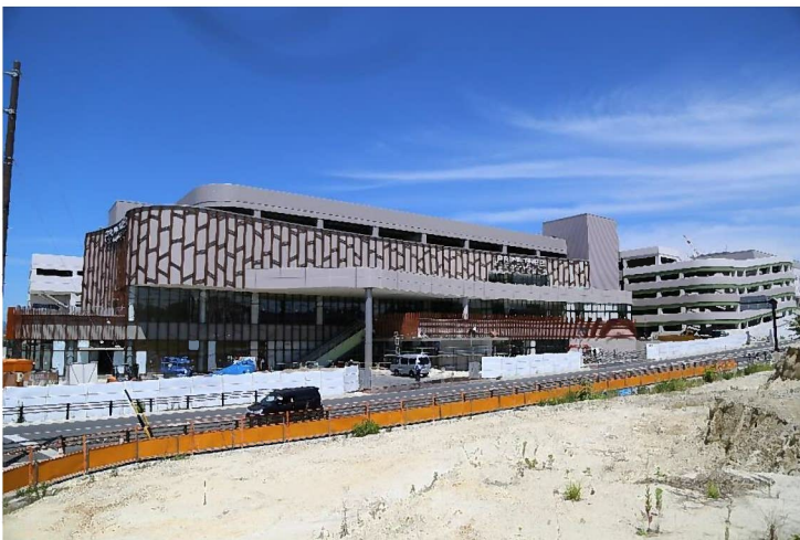
オープンに向け建築中の PRIMETREE AKAIKE（プライムツリー赤池）

なお、本年度秋の PRIMETREE AKAIKE（プライムツリー赤池）オープンにあわせ、当組合も商業施設周辺の公共施設整備を進めてまいります。そのオープンに伴い、多くの来場者により地区内での賑わいが増し、交通量も増すと予想され、工事に際しては、皆様には何かと不便等をおかけする場合がありますが、地域住民の安全第一で工事をしてまいります。何卒ご理解ご協力のほどよろしくお願いいたします。